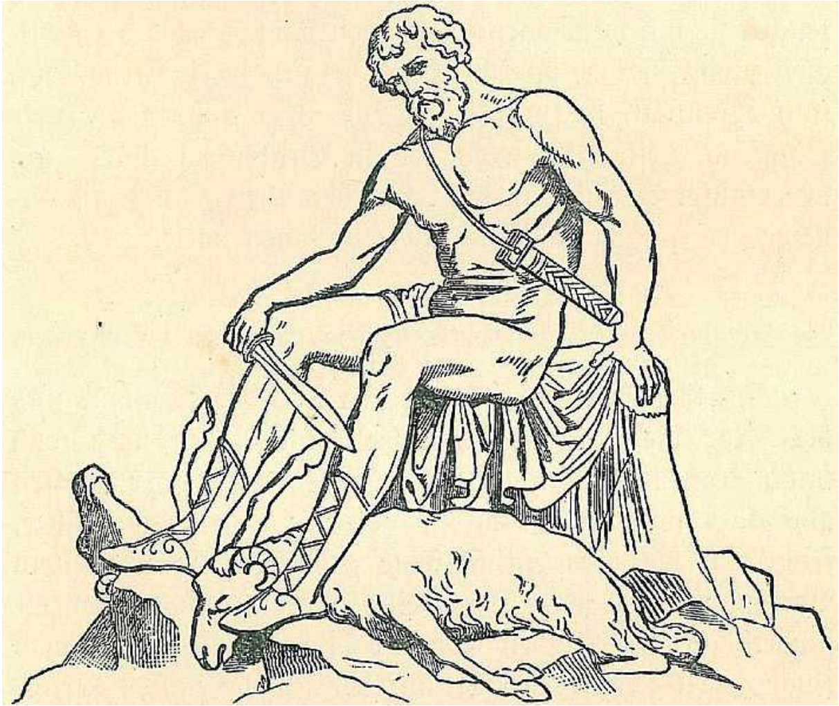
Ajax arietem occidit, quem mente captus putat esse Ulixem.

Tecmessa lacrimans Aiâci appropinquavit, genua circumplexa eum obsecravit, ne se suae vitae sociam solam relinqueret captivam hostibus interpositam; necnon illum rogavit, ut meminisset patris senis et matris Salaminaeae, puerum obtinens illum commonuit, qua sorte parvulus futurus esset, si a duro curatore suppressus custode iuventutis orbatus sine patre adolesceret. Heros autem vehementer commotus filium apprehendit eumque amplexatus et osculatus sic allocutus est: »Mi fili, si patrem felicitate superaveris, aequaveris ceteris omnibus, verê non fies vir improbus. Teucer frater meus germanus certê bene te curabit, sed nunc armigeri mei te ferant ad parentes Telamônem et Eriboeam Salamîne habitantes, ubi illis sis gaudio senescentibus, dum illi quoque abeant ad inferos.« His dictis puerum ministris tradidit, eosdem iussit fratri germano etiam commendare Tecmessam suam amatam, ex eius complexu se eripuit, gladium destrinxit, quem olim dono accepit ab Hectore hoste suo, sôlo tentorii infixit. Deinde manibus versus caelum tentis oravit: »Beneficium modicum, pater Iuppiter, a te precor: Mitte mihi Teucrum fratrem meum germanum, cum primum cecidero, ne antea adversarius meus me investigatum canibus avibusque obiciat