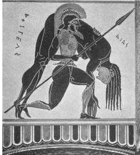
Ajax Achilleum mortuum ferens

Post arma stabat Thētis, cuius caput erat velamine lugubri obtectum; quae maestissima Danaidīs dixit haec: »Victoriae praemia in sollemnia lugubria filii mei exposita omnia iam sunt parta. Nunc autem procedat optimus ille Graecorum, qui corpus servavit, ut ei tribuam arma filii mei magnifica, quae omnia sunt dona divina, quibus gavisī erant ipsi dei immortales.«