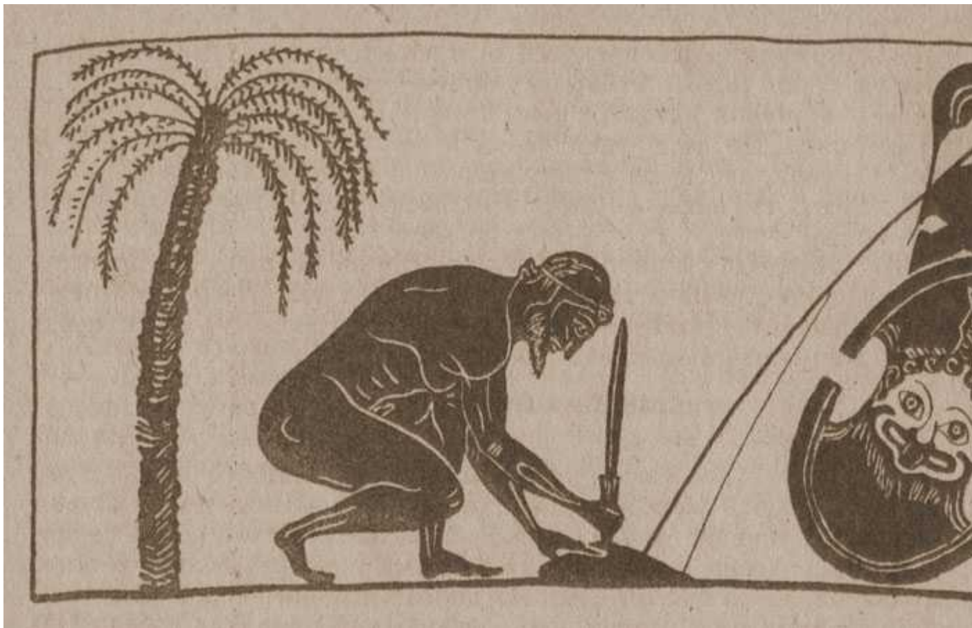
Ajax Salamineus in gladium incubiturus. Imago, quam amphorae impinxit Exécias pictor ingeniosus.

devorandum. Vos autem, Furiae, invoco: ut me hōc loco videbitis vitam finire mei interemptorem, ita illos sinite cadere a sanguine proprio carissimo per insidias interfectos: veniatis, ne cui rei parcatis, per gyrum saturemini toto exercitu! Tu autem, Sol, qui lucens veheris per caelum altum, curru tuo patriam meam Salamīneam supervecturus, moderare habenis et patri meo senili miseraeque matri enuntia fortunam meam acerbam. Vale, radi sancte, vale, Salamis urbs patria; vale, sedes mea Atheniensis cum fluviis tuis fontibusque; vos quoque valetate, loca Troiana, in quibus tam diu versatus sum!