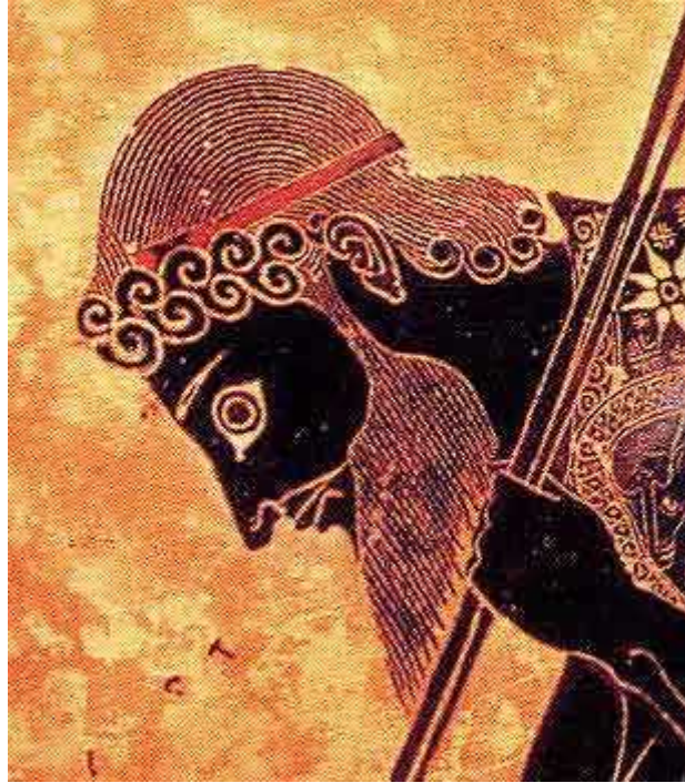
Aiax filius Telamônis. Imago vasis ab Exêciâ picta.

Mythi Classicae Antiquitatis a Gustavo Schwab Theodiscê narrati, a Nicolao Groß Latinê redditi.